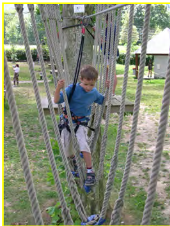
Pont de Cordes