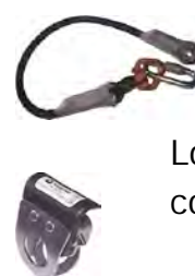
Longe et connecteur

Ce parcours à été réalisé en collaboration avec un bureau d'étude d'ingénieur et nécessite la visite d'un bureau de contrôle à chaque installation.