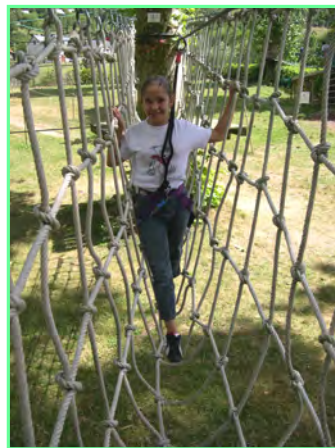
Filet en U